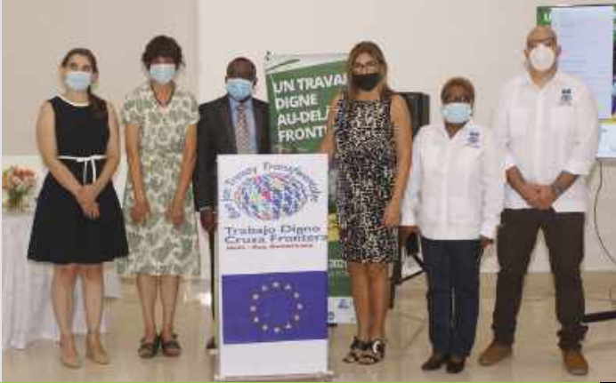
Representantes de AVSI; OBMICA; SJM Haití; la delegación de la Unión Europea, Haití; JILAP; y CESAL, el 1 de mayo de 2021