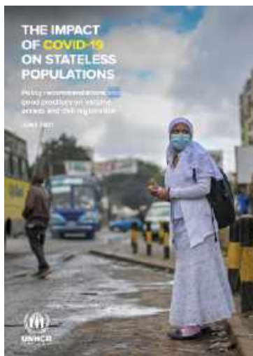
Portada de la publicación de ACNUR

ACNUR (Junio de 2021) “El impacto de Covid-19 en poblaciones apátridas: recomendaciones para las políticas y buenas prácticas sobre acceso a vacunas y el registro civil”. Este Policy Brief detalla información, recomendaciones y buenas prácticas a escala global, específicamente sobre acceso a vacunas y el registro civil. Esta publicación es un seguimiento a la publicación anterior: “Mayo 2020 Policy Brief sobre el impacto de COVID-19 en poblaciones apátridas”.