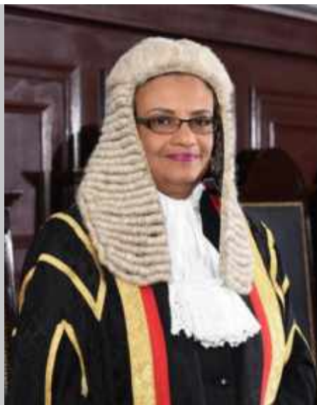
Jueza Maureen Crane-Scott, Corte de Apelación, Nassau, Las Bahamas

Icono de foto de portada: "Corona o comida": un escueto mensaje escrito con tiza azul en el asfalto de una calle del Pequeño Haití, una zona comercial ahora desierta en el centro de Santo Domingo, resume la precaria situación de los inmigrantes haitianos en República Dominicana, marzo de 2020.