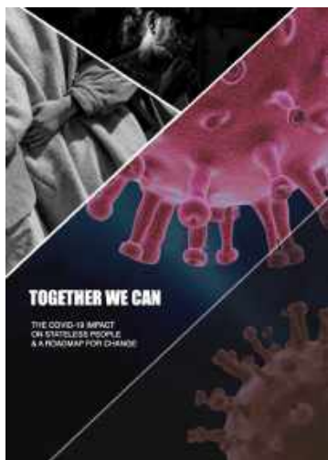
Portada Informe ISI, Junio de 2021

ACNUR (Junio de 2021) “El impacto de Covid-19 en poblaciones apátridas: recomendaciones para las políticas y buenas prácticas sobre acceso a vacunas y el registro civil”. Este Policy Brief detalla información, recomendaciones y buenas prácticas a escala global, específicamente sobre acceso a vacunas y el registro civil. Esta publicación es un seguimiento a la publicación anterior: “Mayo 2020 Policy Brief sobre el impacto de COVID-19 en poblaciones apátridas”.