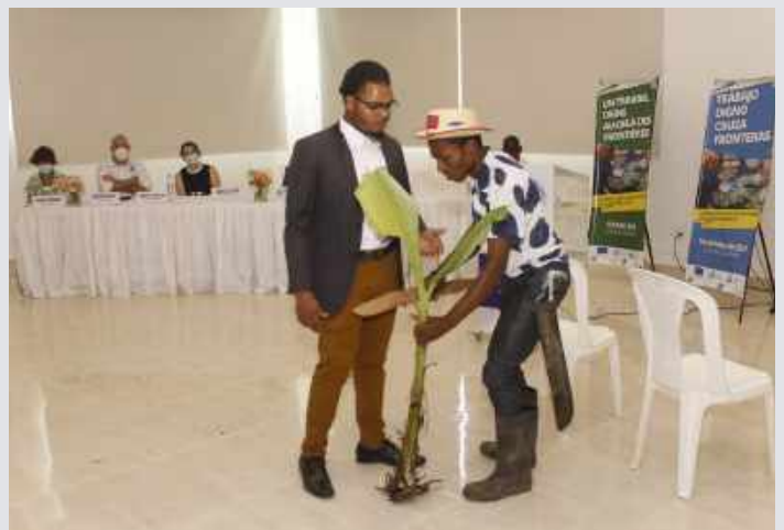
Sociodrama de cierre de la actividad el 1 de mayo