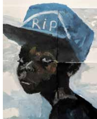
“Descanse en Paz, Querido Niño” (2019) por Laurie Tuchel, artista residente de Gran Bahama

*Pueden leer la declaración completa en el sitio Web del Centro por la Justicia y el Derecho Internacional www.cejil.org/es/estados-deben-erradicar-apatridia-momento-actuar-ahora-0