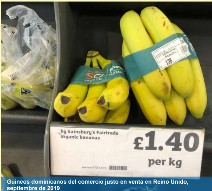
Guineos dominicanos del comercio justo en venta en Reino Unido, septiembre de 2019

E n el marco del proyecto binacional, conocido como “Trabajo Digno Cruza Fronteras”, apoyado por la Unión Europea (EIDHR/2018/155232-3/91), OBMICA tuvo a su cargo un estudio exploratorio en el sector agrícola dominicano con miras a proveer insumos para otros componentes del proyecto llevados a cabo directamente con trabajadores-as, productores y otros actores clave. Junto con OBMICA, los socios implementadores son: Servicio Jesuíta a Migrantes (organización líder, basada en Haití), Fundación AVSI, la Comisión Episcopal para la Justicia y la Paz (JILAP), y CESAL.