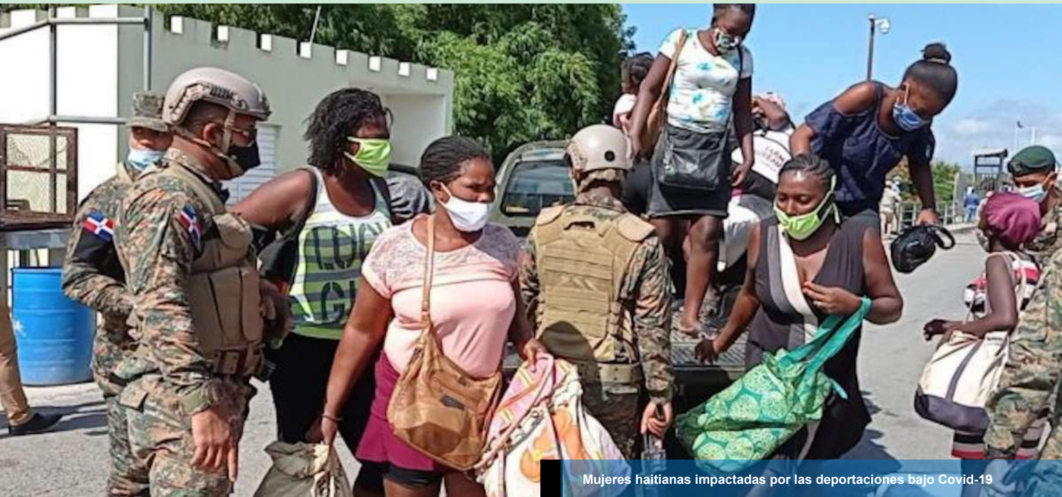
Mujeres haitianas impactadas por las deportaciones bajo Covid-19

Las deportaciones de los inmigrantes en situación irregular se reanudaron oficialmente el 21 de septiembre de 2020, a pesar de la pandemia del COVID-19 y de las medidas previstas para enfrentarlo. Hay que recordar que las deportaciones fueron suspendidas en el marco de un conjunto de medidas de protección contra el Covid-19, incluso el cierre de la frontera terrestre entre la República Dominicana (RD) y Haití. Hoy, sin embargo, con la continuación del Estado de Emergencia y el toque de queda, las mascarillas obligatorias, el distanciamiento social y la frontera terrestre entre la República Dominicana (RD) y Haití todavía cerrada, las autoridades decidieron reanudar las deportaciones.