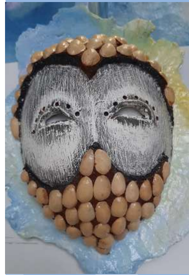
Icono de portada: Máscara enmascarada, bajo Covid-19, del artista Jean Philippe Moiseau.

En la medida en que la importancia médica de mascarillas se ha aumentado en la pandemia COVID-19, también lo ha hecho su valor artístico.