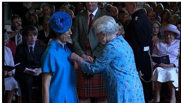
Coordinadora de OBMICA es condecorada por la Reina de Inglaterra

http://www.progression.org.uk/blog/news/friend-progressio-rieves-obe