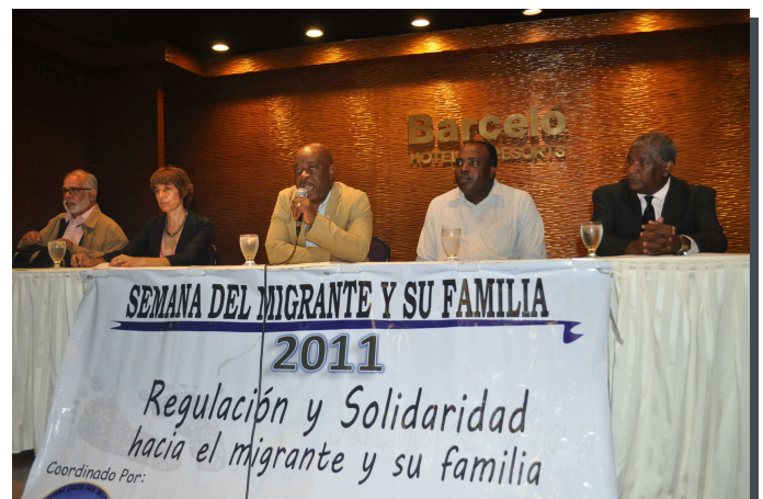
Clausura de la semana migrante y su familia

dominico-haitianas y analizó minuciosamente la coyuntura en cuanto a la inmigración de haitianos al país, revelando los desafíos tanto para los inmigrantes como para sus descendientes nacidos en el país. Advirtió sobre la situación cambiante a raíz del terremoto en Haití de enero de 2010.