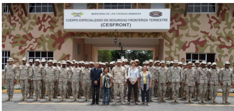
OBMICA y los egresados de la capacitación, Capotillo.