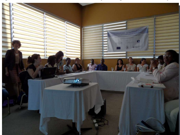
Conversatorio organizado por OBMICA sobre el trabajo doméstico remunerado

Todo para asegurar condiciones de trabajo decente para las personas que cuidan hogares, niñas/os, jardines, nuestra ropa, nosotros. Todo para reconocer que la extranjera en la casa no sólo sea tratada como una más de la casa – sino una trabajadora, sujeto de derechos en RD. Y nos preguntamos: ¿será que lo podemos lograr, si seguimos conversando?