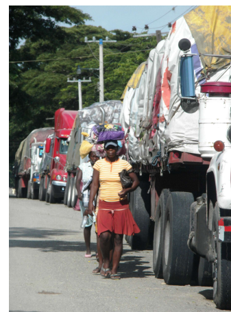
Mujeres migratorias. Carrizal, Comendador

El informe concluye con una serie de recomendaciones para las organizaciones de sociedad civil, autoridades locales, organismos internacionales, tomadores de decisiones políticas y las mismas mujeres migratorias, con miras a poner fin a las múltiples violaciones de derechos humanos que sufren las migrantes haitianas en la frontera dominico-haitiana.