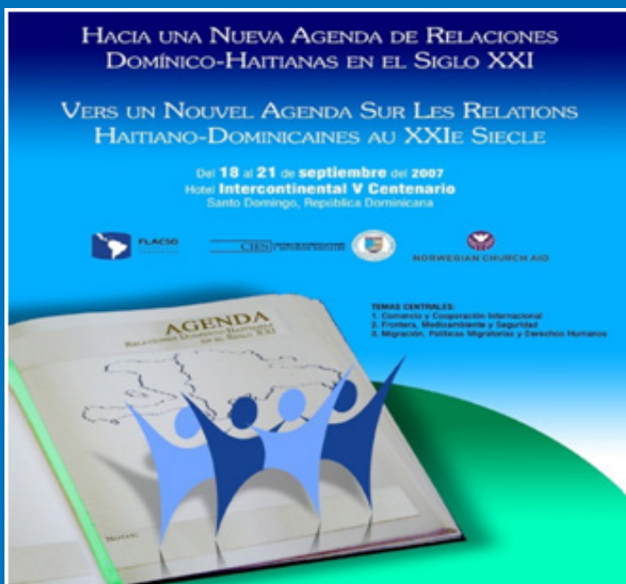
Afiche para conferencia binacional, septiembre de 2007

Esta edición celebra la década de vida de nuestro observatorio. Diseño sencillo y elocuente que agradecemos a Editora Búho.