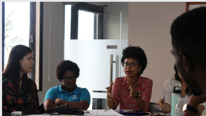
Un debate tomó lugar después de la presentación.

Tras la presentación tuvo lugar un debate interesante, donde los presentes, más allá de felicitar la iniciativa de OBMICA y UConn, animaron, incluso, a repetir la experiencia, tratando de enfocarse en los años electorales en República Dominicana.