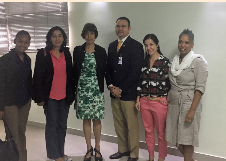
El equipo de ASCALA y de OBMICA, en su encuentro con el general Rafael Núñez, director de extranjería de DGM.

El 15 de febrero de 2018 se sostuvo un encuentro con funcionarios de la Dirección General de Extranjería de la Dirección General de Migración (DGM), organizado por OBMICA como parte de las actividades de diálogo y devolución de resultados en torno al Anuario Estado de las Migraciones 2016 , publicado en 2017.