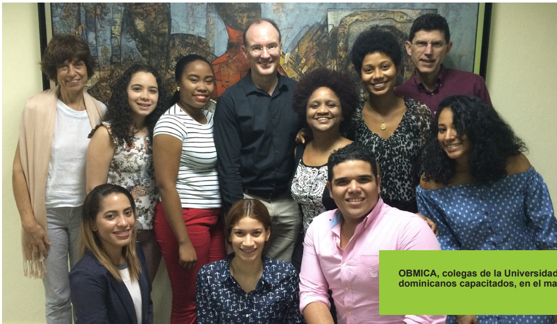
OBMICA, colegas de la Universidad de Connecticut y jóvenes dominicanos capacitados, en el marco del proyecto.

Después del terremoto en Haití en 2010, la Universidad de Connecticut (UConn) promovió una experiencia en la que estudiantes de comunicación social de esa academia analizaron las representaciones de las y los haitianos en los medios de los Estados Unidos, antes de participar en el terreno con la reconstrucción post-terremoto. Desde su perspectiva lo que experimentaron en Puerto Príncipe tuvo poco que ver con los estereotipos negativos prevalecientes en la prensa estadounidense, puesto que lo que constataron fue más bien la resiliencia de las y los haitianos en circunstancias adversas.