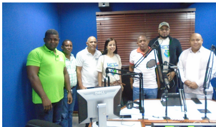
Miembros de OBMICA con staff del programa radial "Impacto Mañanero" emisora 89.7 FM para Barahona y la Región Enriquillo