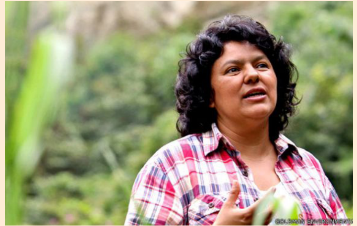
Berta Cáceres, ambientalista hondureña, fue asesinada el 4 de marzo de 2016

¿Cómo mejorar la gestión de la migración a nivel mundial? Encontrar respuestas a esta pregunta es una de las prioridades en la agenda de las Naciones Unidas para el presente año. La organización se encuentra actualmente guiando a distintos gobiernos hacia negociaciones determinantes sobre el llamado “Pacto Mundial sobre Migración”, a abordarse en una conferencia intergubernamental en septiembre en Nueva York. Además de acciones a escala mundial que tengan en cuenta el tema de los derechos humanos en el contexto del cambio climático y del medioambiente, no es menos importante prevenir de cara a posibles efectos ambientales negativos de proyectos de desarrollo en las comunidades. Felizmente, las Américas nuevamente han tomado la delantera en un acuerdo sin precedentes que se explica abajo.