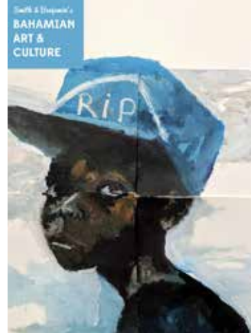
“Descanse en Paz, Querido Niño” (2019) por Laurie Tuchel, artista residente de Gran Bahama

*Pueden leer la declaración completa en el sitio Web del Centro por la Justicia y el Derecho Internacional www.cejil.org/es/estados-deben-erradicar-apatridia-momento-actuar-ahora-0