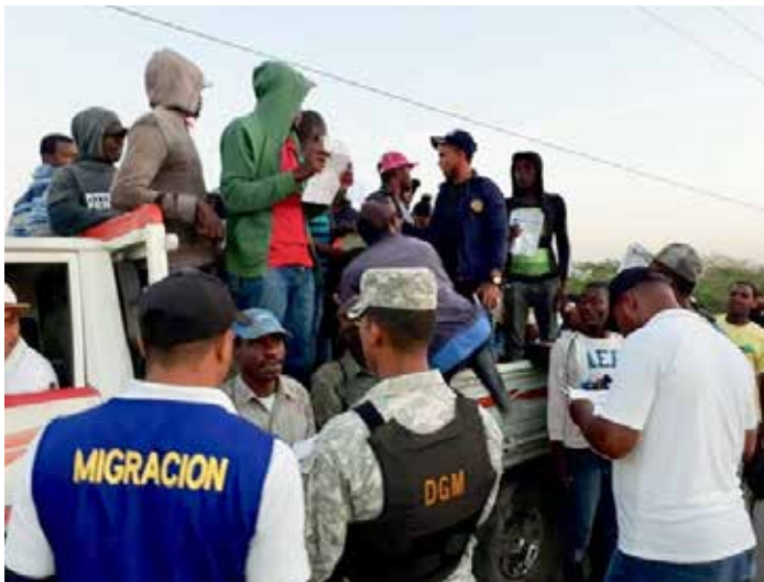
Migración interviene franja fronteriza

El propósito de este Migration Policy Brief , de la autoría de Charlotte Wiener, consiste en resaltar la situación de las deportaciones después del cierre del período de registro del Plan Nacional de Regularización de Extranjeros