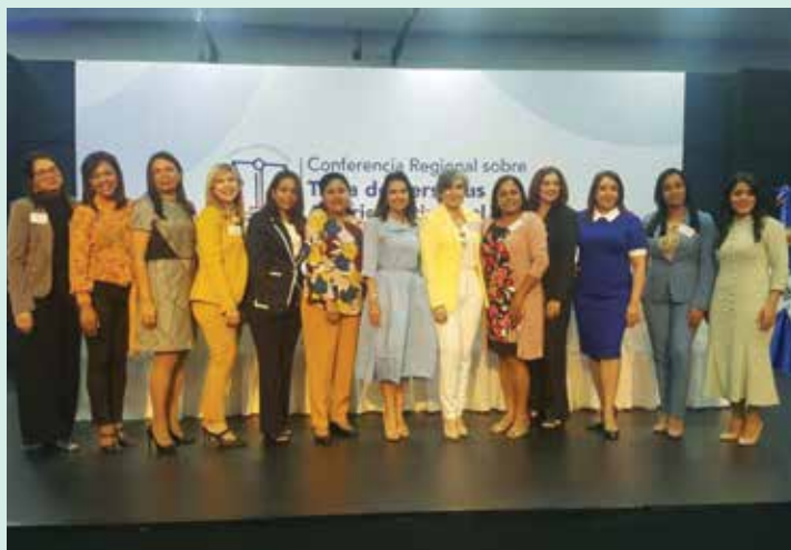
Mujeres juezas al final de la conferencia en MIREX, julio de 2019