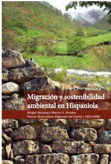
Portada del libro Migración y sostenibilidad ambiental en Hispaniola

Este proyecto se realizó conjuntamente entre equipos de investigadores y especialistas en planificación para el desarrollo de la República de Haití y la República Dominicana. El área de intervención geográfica fueron los parques nacionales Nalga de Maco (República Dominicana) y Pic Macaya (República de Haití), representando ambas áreas protegidas lugares donde se pueden estudiar de forma privilegiada las interacciones entre el medio ambiente, el manejo de los recursos naturales, la migración y las actividades económicas de las poblaciones locales.