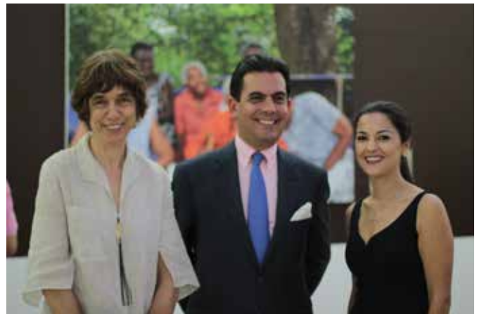
ACNUR, OBMICA y la fotógrafa en la inauguración el 10 de abril.