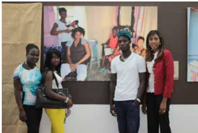
Público y fotografía de la exposición.

Me inicié en la fotografía y dirección documental como un pasatiempo en Marruecos en el 2004 y continué mis estudios en dirección de películas en Boston University. Llegué a la fotografía y la dirección fílmica desde un área similar, ya que trabajaba como profesional de comunicación por más de 10 años en Estados Unidos, Marruecos y Qatar. Trabajé en organismos internacionales y el sector privado contando historias "organizacionales"... pero al fin... historias.