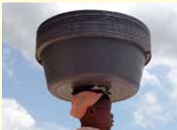
Mujer migrante haitiana transfronteriza.

Nos complace reportar que está disponible en OBMICA la traducción al inglés del libro Fanm nan fwontyè, Fanm toupatou: Una mirada a la violencia contra las mujeres migrantes haitianas, en tránsito y desplazadas en la frontera dominico-haitiana (Elías Piña/Belladère). El estudio fue comisionado por la Colectiva Mujer y Salud y Mujeres del Mundo, llevado a cabo por OBMICA y co-financiado por la AECID y la OIM. Ha servido de insumo para el artículo titulado