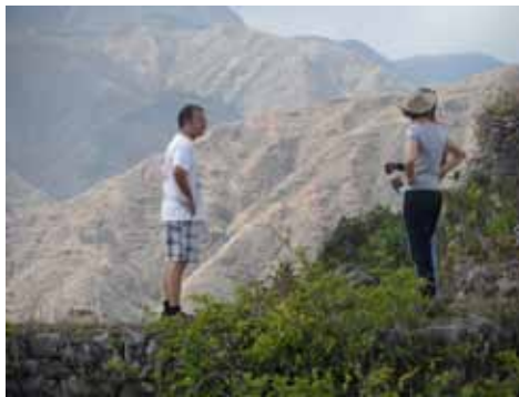
Equipo OBMICA en el terreno, alrededores del Parque Pic Macaya, Haití

Cada vez son más las personas que abandonan los lugares que les han visto crecer debido a precarias condiciones económicas. Estos migrantes son conocidos comúnmente como migrantes económicos. De forma similar, la pobreza tiene un impacto sobre los recursos naturales, ya que la misma suele poner a los grupos huma-