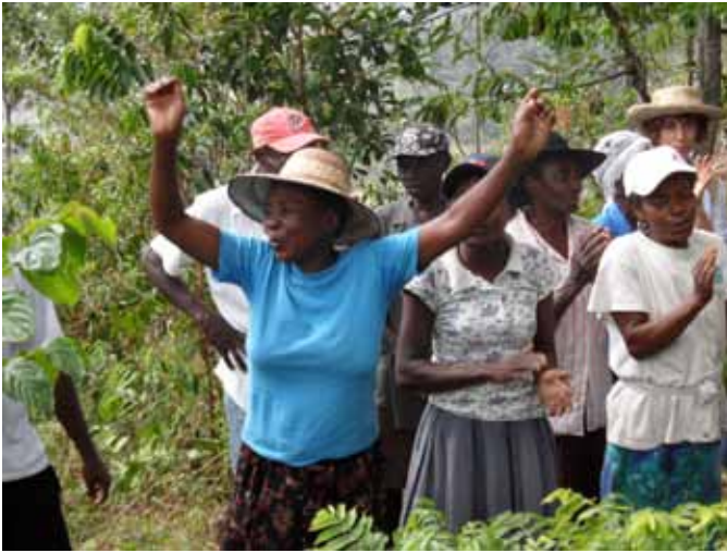
Las mujeres organizadas llevan la voz cantante en el campo, zona de tampón Parque Pic Macaya

de las zonas vulnerables a la degradación ambiental y a partir de ese conocimiento elaborar estrategias de intervención que reduzcan los conflictos ambientales, permitan un mejor conocimiento de las problemáticas locales y que las comunidades establezcan las condiciones para mantener de forma sostenida su desarrollo.