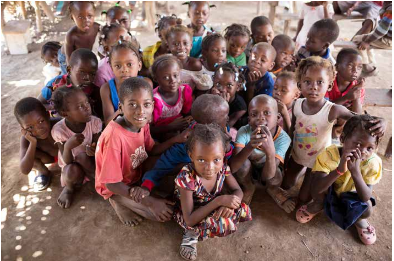
Campamento Parque Cadeau

129,000 personas abandonaron voluntariamente el territorio dominicano por esos puntos fronterizos desde mediados de junio de 2015 y que más de 15,000 personas fueron expulsadas de territorio dominicano en repatriaciones oficiales desde mediados de agosto de 2015.