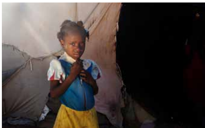
Cara en limbo, campamento Parque Cadeau.

Inmigrantes haitianos/as, que no lograron un status migratorio positivo, se vieron en la necesidad de salir de manera forzosa hacia Haití utilizando los cuatro binomios fronterizos de mayor afluencia de personas, que fueron oficialmente señalados por el gobierno dominicano: Jimaní/