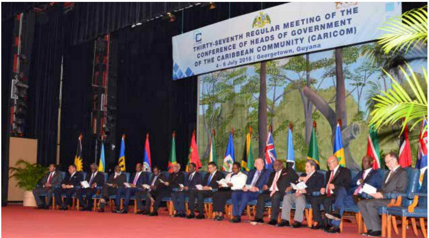
Los Jefes de Estado en reunión de CARICOM, julio de 2016.

encuentro con sociedad civil el 13 de junio en el nuevo centro de convenciones del Ministerio de Relaciones Exteriores (MIREX).