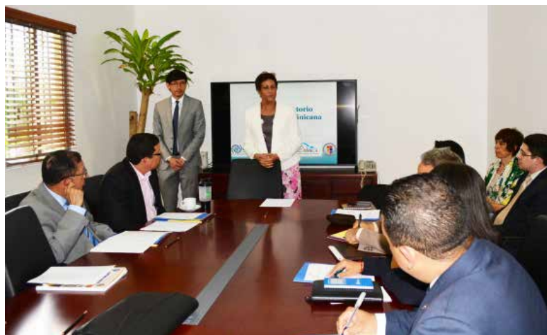
La Directora del INM-RD, Doctora Florinda Rojas, inaugura el encuentro inter-ministerial el 1 de junio de 2016.

El Instituto Nacional de Migración de la República Dominicana (INM-RD) realizó la presentación del proyecto 'Creación del primer perfil migratorio', con el fin de apoyar la labor y misión institucional del INM-RD en el diseño de políticas públicas para promover la gestión ordenada de la migración y el desarrollo en el país caribeño. El estudio tiene como objetivo construir un perfil migratorio que describa y analice la situación migratoria actual y las variables que inciden en dichos flujos de personas. Este plan servirá de instrumento para enmarcar de manera estructurada y sistemática, los datos existentes e información de fuentes internacionales, nacionales y regionales para apoyar las políticas del gobierno dominicano sobre la migración y el desarrollo.