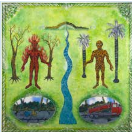
Obra de Duval Carrié titulada Hispaniola Saga en portada de programa para módulos de enseñanza con estudiantes haitianos, organizados por Hispaniola Transnacional, Hotel Plaza, 5 al 11 de junio de 2016.

Además de hacer una ponencia en el marco de la conferencia, la Directora de OBMICA ha participado como docente en dos módulos de enseñanza, relacionados