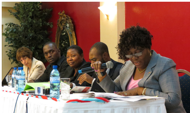
La Jueza François diserta en el conversatorio del 20 de marzo, 2015

En una cita a la que asistieron más de 50 representantes de organizaciones de la sociedad civil, la academia, el sistema judicial en Haití, cancillería y funcionarios nacionales e internacionales, el Centro para la Observación Migratoria y el Desarrollo Social en el Caribe (OBMICA), en representación de ObservaLAtrata en RD, fue invitado por homólogos en el país vecino a participar en el conversatorio del 20 de marzo de 2015 en el Hotel Plaza, Place de Champ de Mars, Puerto Príncipe. En dicho encuentro dejaron constituido el Capítulo Nacional del Observatorio Latinoamericano sobre Trata y Tráfico de