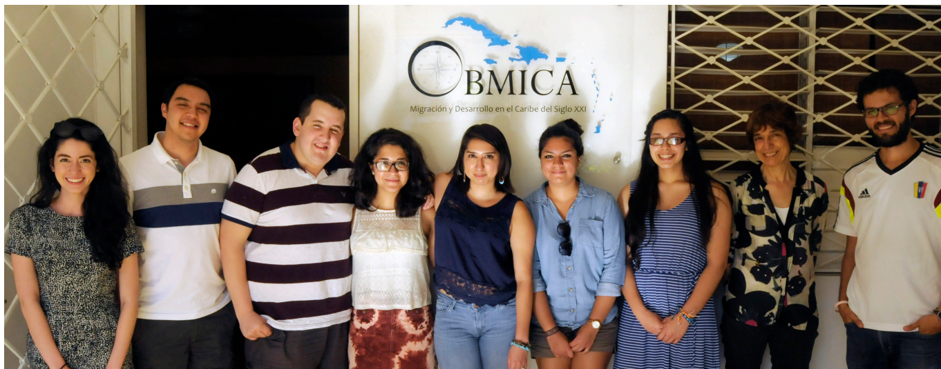
Estudiantes provenientes de la Universidad de Williams junto al personal de OBMICA.

Durante el mes de marzo de 2015, OBMICA recibió el apoyo de un grupo de estudiantes provenientes de la Universidad de Williams, EEUU. Los/as estudiantes, latinos de nacimiento y origen, se constituyeron en una entusiasta continuación del intercambio iniciado por OBMICA el año 2014 con otros estudiantes de la misma Universidad. Su colaboración consistió en motorizar procesos de acompañamiento a las personas beneficiarias de la ley 169-14, población con la que se sienten plenamente identificados y de quienes conocieron de primera mano testimonios sobre los obstáculos que deben enfrentar para el reconocimiento de su derecho a la nacionalidad en República Dominicana.